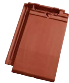
NATURRØD+ (652) Glansværdi 1