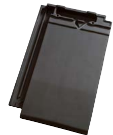
MAT SKIFERSORT GLASERET (756) Glansværdi 55