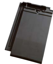
SKIFER ENGOBERET (703) Glansværdi 2