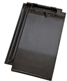
MATSORT GLASERET (744) Glansværdi 40