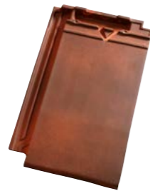
RUSTIK ENGOBERET (872) Glansværdi 2