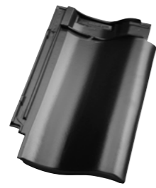
VULKANSORT ÆDELENGOBERET (755) Glansværdi 8