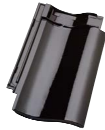
SORT GLASERET (738) Glansværdi 98