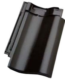
SORT ÆDELENGOBERET (745) Glansværdi 21