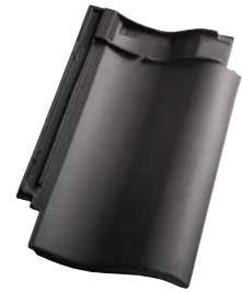
SKIFER ENGOBERET (703) Glansværdi 2