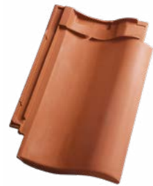
NATURRØD+ (652) Glansværdi 1